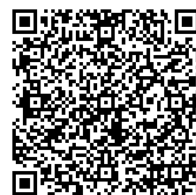
滝沢市HP たきざわカーボンニュートラルチャレンジ

共同利用申し込みの受付は、5月21日(火)の10時からメールでのみ受け付けます。詳しくは右のQRコードから、市のホームページを御覧ください。